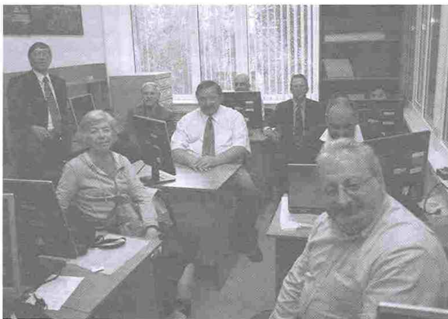
Открытие в ТГТУ документационного центра по экологическому праву и политике (июнь, 2008 г.)

разовательное сообщество. Вузы обрели возможность предлагать свои образовательные услуги на международном рынке. С этого момента руководство университетов стало ощущать потребность в опыте работы зарубежных вузов в рыночных условиях, т.е. в условиях довольно жесткой конкуренции, высоких стандартов качества подготовки выпускников, ответственности перед обществом за выделяемые на образование средства.