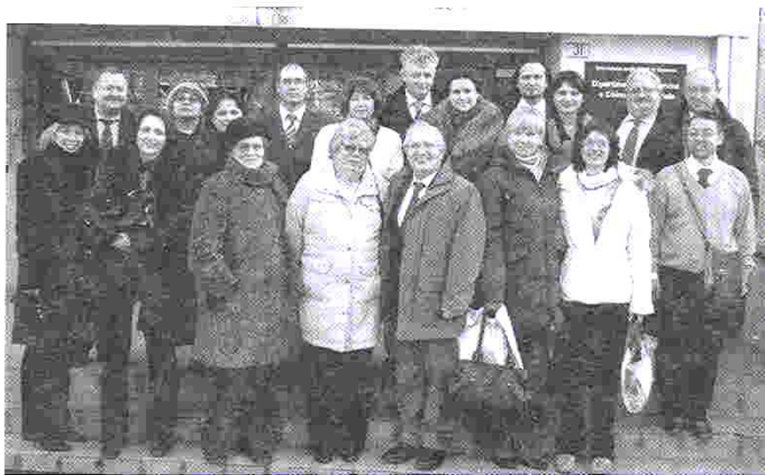
Команда проекта NETWATER (январь, 2010 г.)